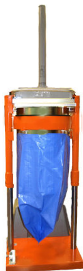
Tømningshøjde 2.660 mm er standard

Det er nemt at ifylde materiale i den topbetjente enhed. Kompaktoren er nem og sikker at manøvrere og den indbyggede løftefunktion gør poseskift hurtigt og nemt.